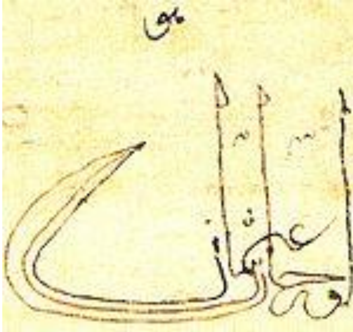
أول طغراء: طغراء السلطان العثماني أورخان غازي