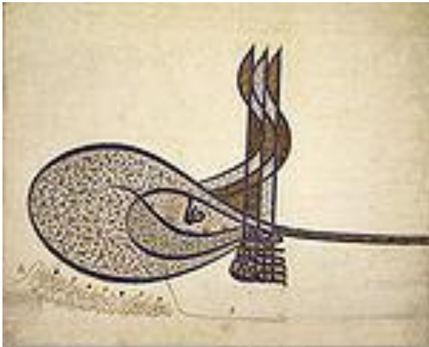
طغراء السلطان العثماني سليمان القانوني