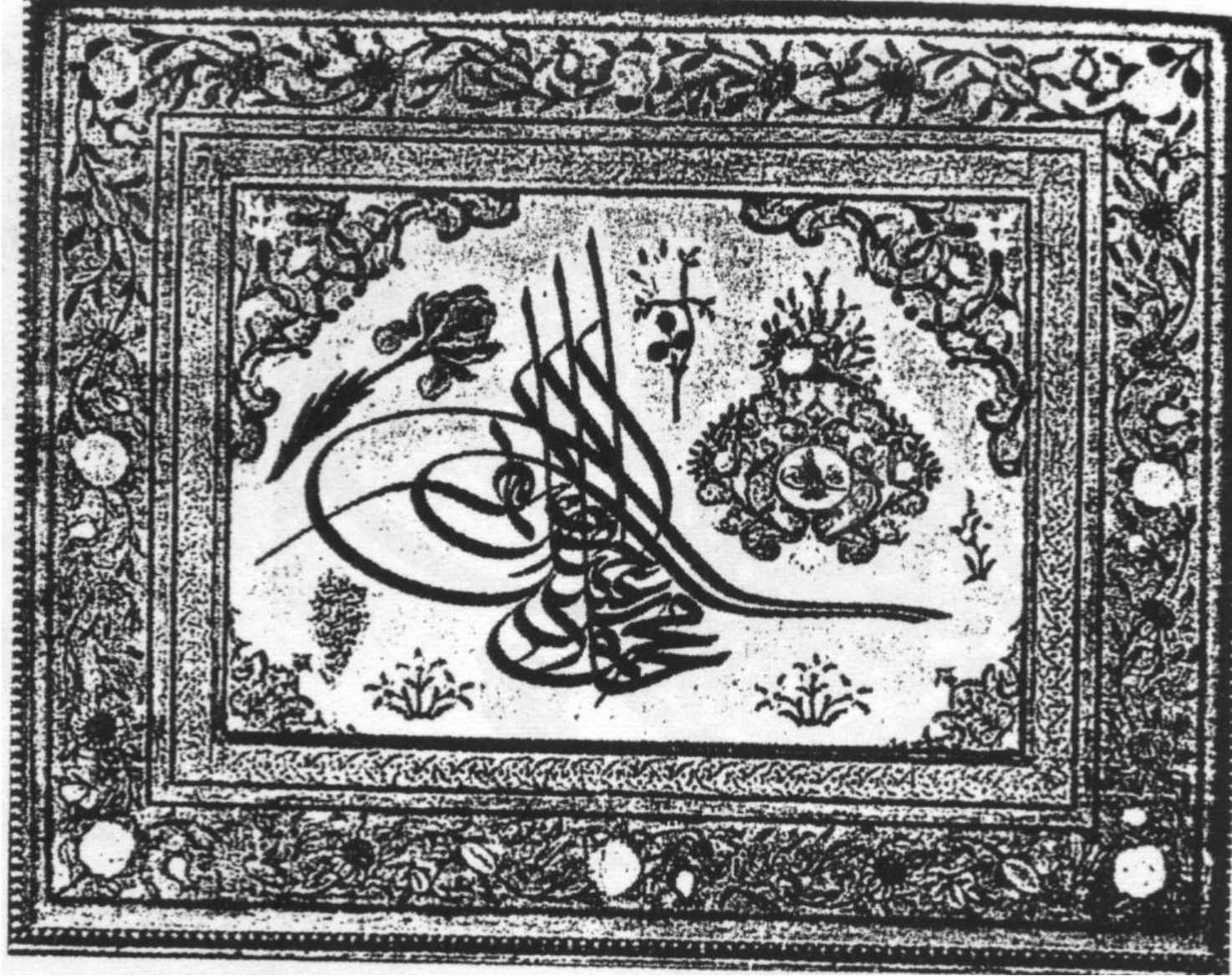
طغراء رسمها "مصطفى راقم" للسلطان "محمود الثاني" ونصها "محمود بن عبد الحميد خان مظفر دائما"